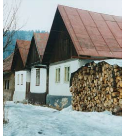
Tri domčeky tirolských baníkov z roku 1740 na Jilemnického ulici v Hronci)

Pomenovanie Tirolská ulica používali v Hronci až do veľkého dejinného zlomu po druhej svetovej vojne. Potom miestni komunisti vymysleli nový názov Jilemnického ulica, ktorý slúži dodnes. Učiteľ a spisovateľ Peter Jilemnický bol Čech, učil ale na Slovensku, aj písal po slovensky o slovenských robotníkoch. V Hronci nikdy nebol. Zdržoval sa síce v našom kraji, ale len na tvorivom pobyte v susednom Čiernom Balogu, kde zbieral materiál pre svoj román Kronika o protifašistickom odboji. Núka sa myšlienka vrátiť tejto ulici pôvodný názov. Presnejší a výstižnejší, aby to súviselo s bohatou priemyselnou históriou Hronca. Čo na to občania? Tirolská ulica by bol názov originálny a ani samotný Jilemnický by asi nebol proti. Veď takýto názov mieri tiež na poctivých robotníkov - tirolských baníkov, ktorí pomáhali šíriť slávnu železiarsku históriu obce.