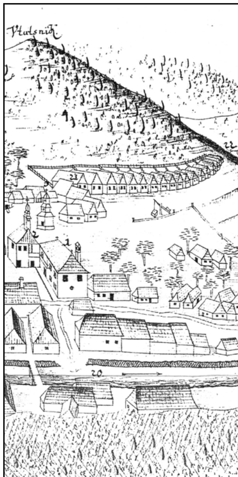
18 domčekov tirolských baníkov na kresbe hrončianskej huty z roku (1765)

Aby bol dokonale využitý pracovný potenciál tirolských rodín, ženy baníkov boli zamestnané pri stavbe – kopaní už spomínaného mašného jarku. Z 200 „šichníkov“ tam pracujúcich bola až polovica žien. Rodiny si čoto priliepli k platom otcov. Ženy aj s deťmi